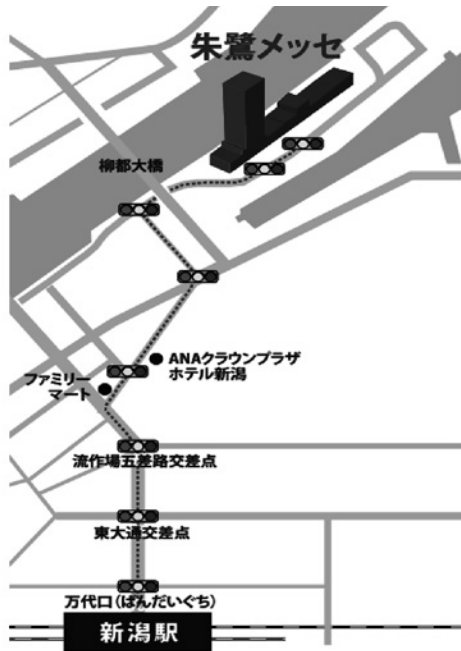
新潟駅万代口→東大通交差点→流作場五差路交差点→ファミリーマート右折→ANAクラウンプラザホテル新潟前→柳都大橋方面→朱鷺メッセ